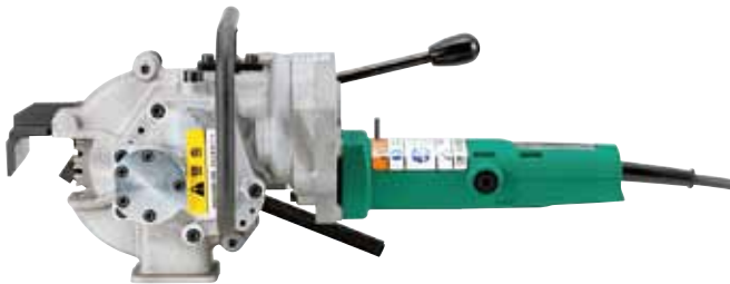
鉄筋径D19~D38対応 SDC-38A コードタイプ