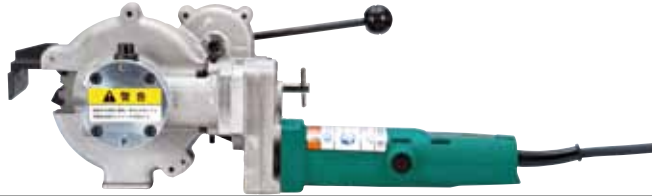
鉄筋径D19~D32対応 SDC-32C1 コードタイプ