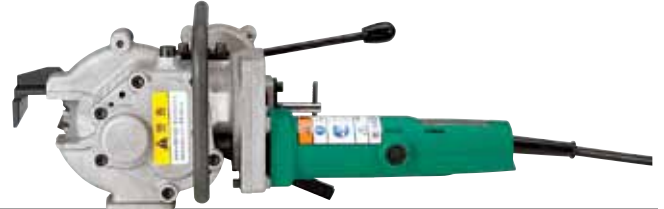
鉄筋径D19~D32対応 SDC-32D コードタイプ