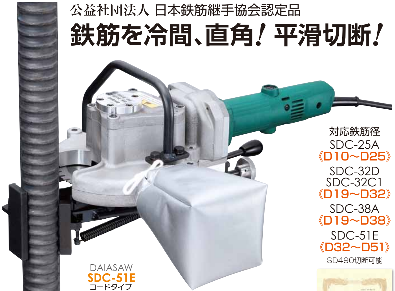
DAIASAW SDC-51E コードタイプ