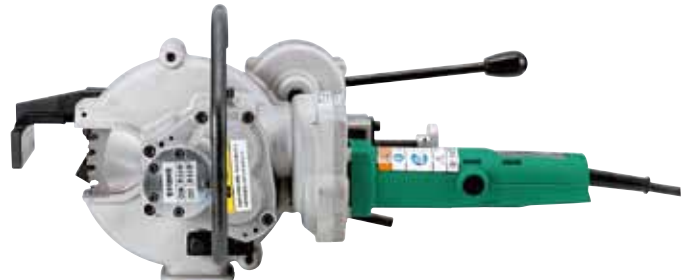
鉄筋径D32~D51対応 SDC-51E コードタイプ