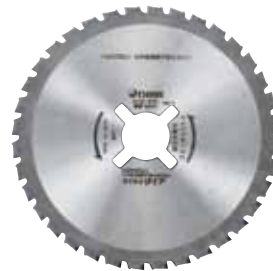
SDCチップソー [スプライン]