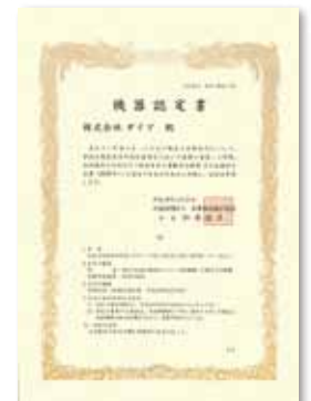
(公社)日本鉄筋継手協会認定書