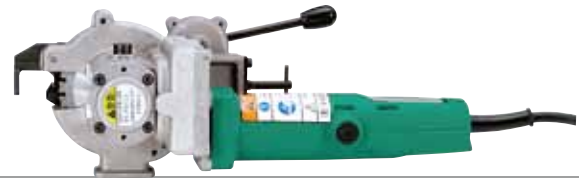
鉄筋径D10~D25対応 SDC-25A コードタイプ